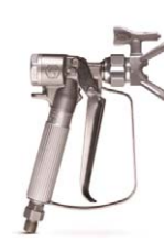
GRACO XTR-7 Airless-Spritzpistole

Hinweis: Alle Filter in der Spritzpistole müssen entfernt werden!