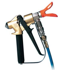
WIWA 500F PFP Airless-Spritzpistole